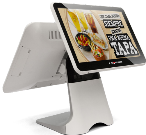
Segunda pantalla de 13.3"